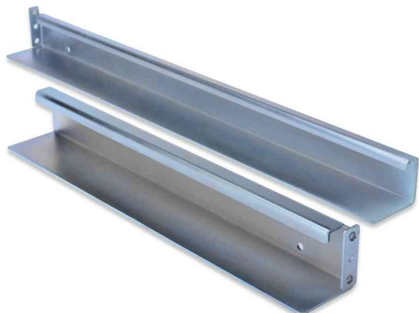
L-Support Gleitschienen-Set für Serverschränke