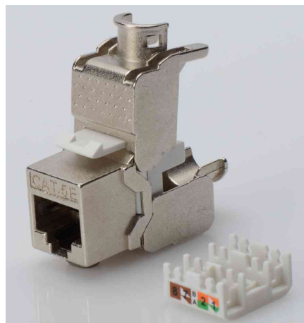
Keystone Modul Kat. 5e