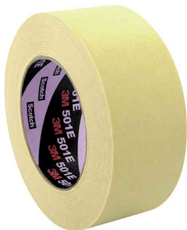
Ruban adhésif 501E