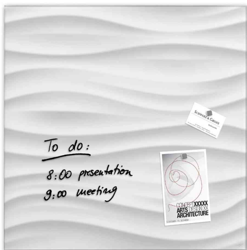
Glas-Magnettafel "artverum", White-Wave