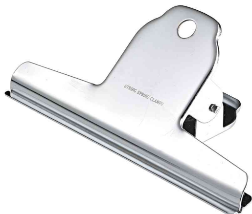
Pince à dessin