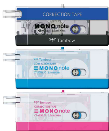
Korrekturroller "MONO Note"