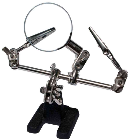
Montageständer "3te Helfende Hand"