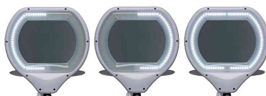
LEDs in 3 Bereichen dimmbar