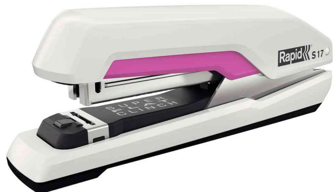
Heftgerät Supreme S17, weiß / pink