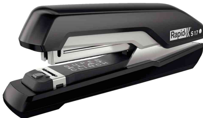
Heftgerät Supreme S17, schwarz / grau

- als Tisch- und Hand-Heftgerät geeignet