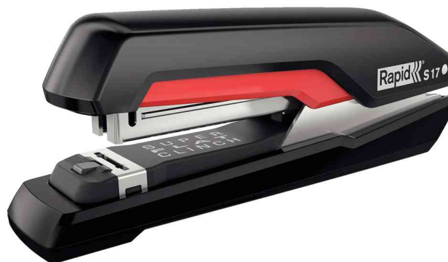
Heftgerät Supreme S17, schwarz / rot