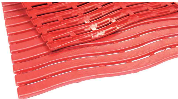
Arbeitsplatzmatte Yoga Soft Step, rot