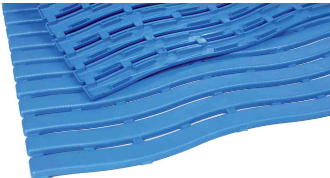
Arbeitsplatzmatte Yoga Soft Step, blau