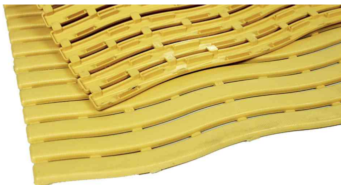
Arbeitsplatzmatte Yoga Soft Step, gelb