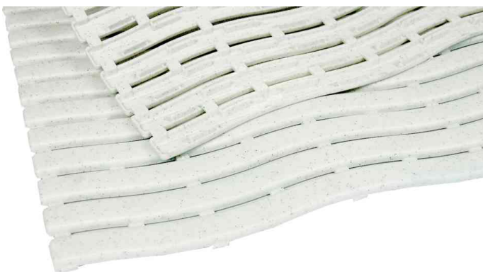
Arbeitsplatzmatte Yoga Soft Step, weiß