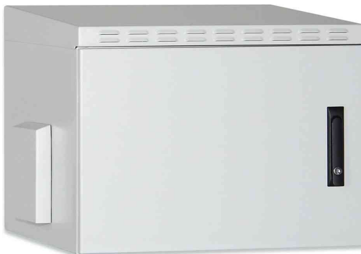
Distributeur mural 19" OUTDOOR