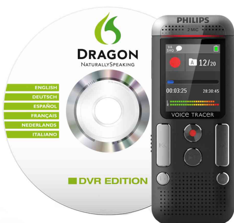
Dictaphone numérique DVT2700