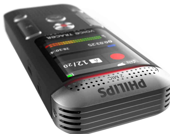
Dictaphone numérique DVT2700, vue latérale détaillée