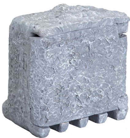
Garten-Steckdosenverteiler "Steinoptik", geschlossen