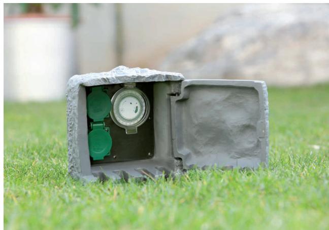
Garten-Steckdosenverteiler "Steinoptik", Anwendung