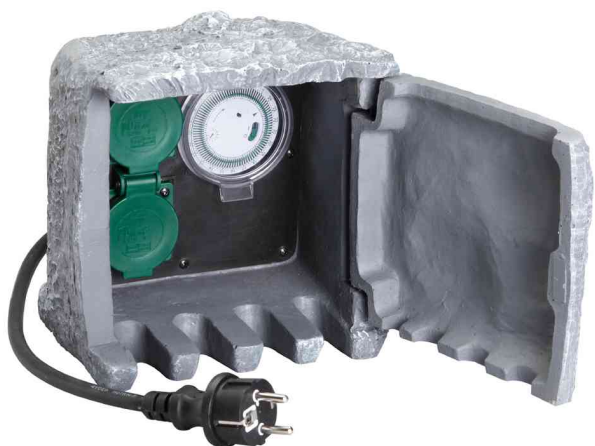
Garten-Steckdosenverteiler "Steinoptik", mit Zeitschaltuhr