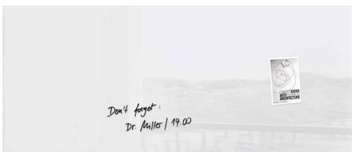
Glas-Magnettafel "artverum", weiß