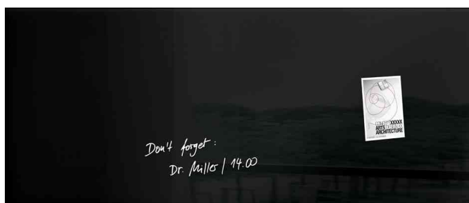
Glas-Magnettafel "artverum", schwarz