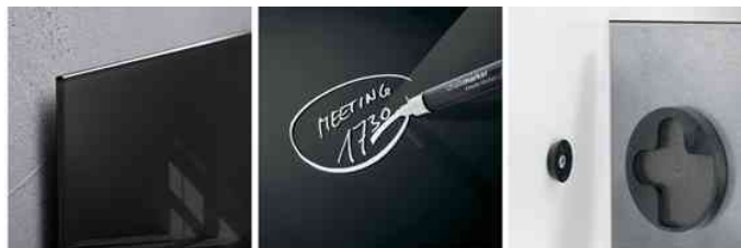
Detailansicht - Beschriftbar - Befestigung