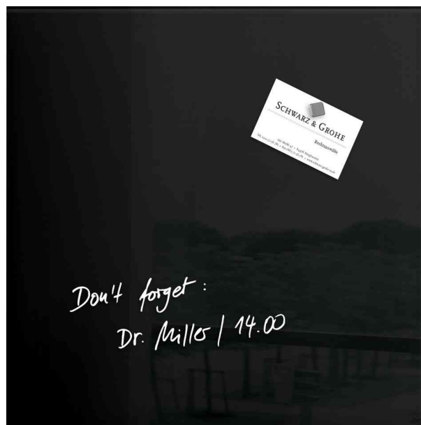
Glas-Magnettafel "artverum", schwarz