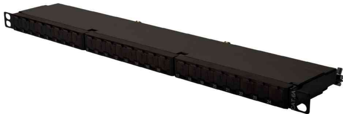
19" Patch Panel Kat. 6A, Klasse EA

• 0,5 HE benötigt das Panel an Platz im Netzwerkschrank, somit können auf 1 HE bis zu 48 Ports verbaut werden! • 24 x RJ45 Kupplungen • für bis zu 500 MHz • Kabelinstallation über LSA Leisten, farbcodiert nach EIA/TIA 568 A & B • Fixiermöglichkeit für Kabelbinder, zentraler Erdungsanschluss • geeignet für 10 GBit Ethernet • mit integrierten Staubschutzklappen, um die Verschmutzung in den RJ45 Buchsen so gering wie möglich zu halten • Gehäuse: 1,5 mm galvanisierter kaltgewalzter Stahl gem. EN1.4301, UNS S30400, AISI 304 and LMSAD110 • 360°-Schirmkontaktierung • entspricht dem 802.3at PoE+ und dem 802.3af PoE Standard • Farbe: schwarz (RAL 9005)