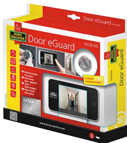
Espion électronique de porte