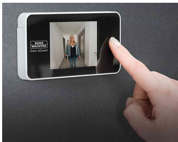
Espion électronique de porte, utilisation