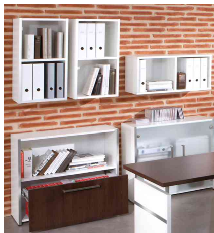
Wandregal "Form 4", Anwendungsbeispiel