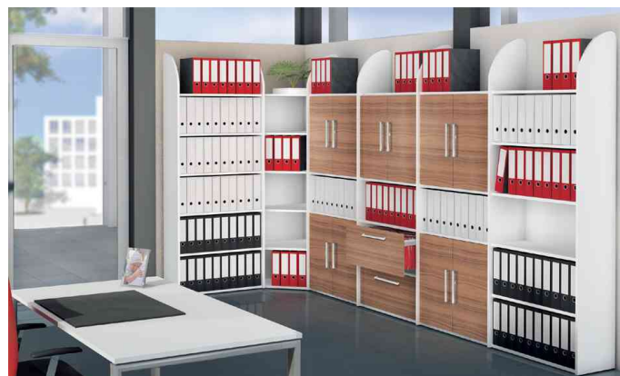
Regal- & Schranksystem Dante - Anwendungsbeispiel