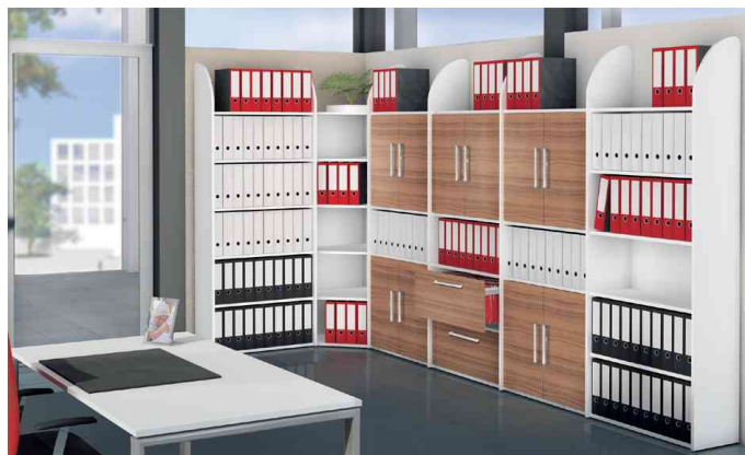
Regal- & Schranksystem Dante - Anwendungsbeispiel