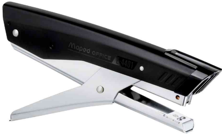
La pince agrafeuse Essentials E4401