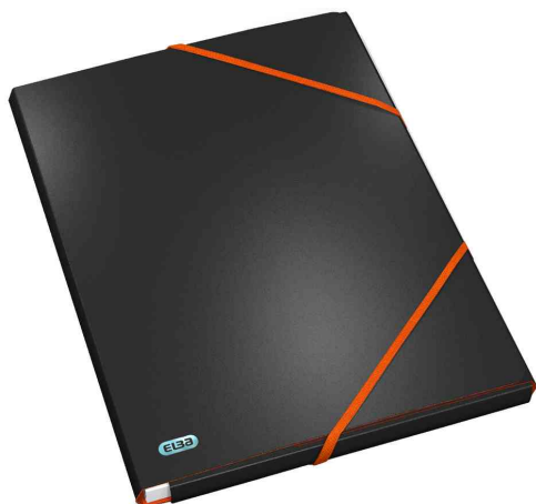
Eckspannermappe XL "ELBA for Students"

Weitere Produkte der ELBA for Students Serie finden Sie im WebShop!