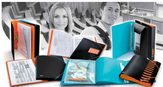
Serie ELBA for Students