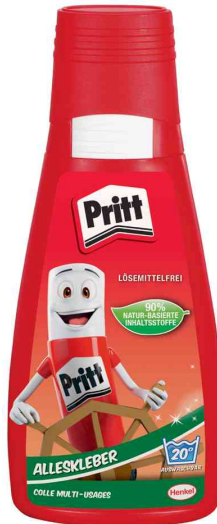
Alleskleber, 100 g