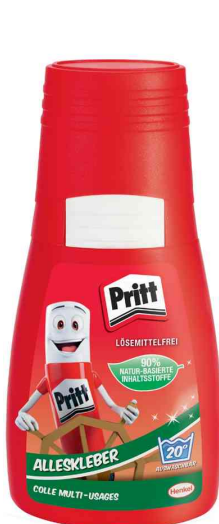
Alleskleber, 50 g