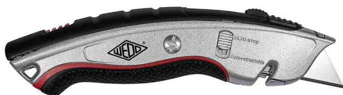
Safety-Cutter Profi Plus