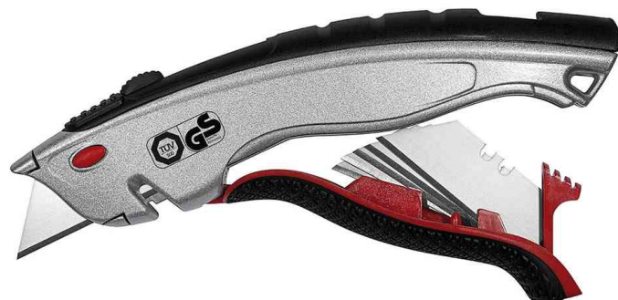
Safety-Cutter Profi Plus, Klinsenmagazin