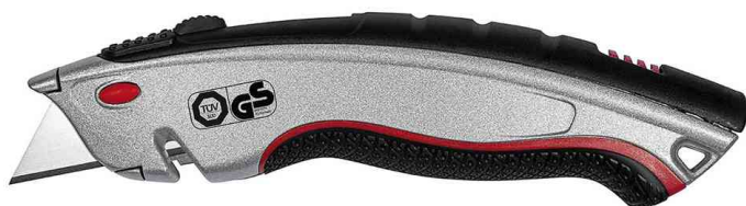
Safety-Cutter Profi Plus