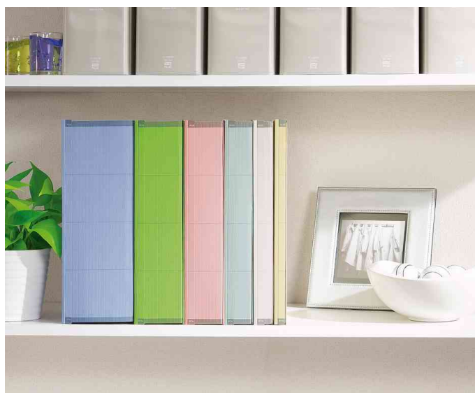
Archivierungsordner ZEROMAX, Anwendungsbeispiel