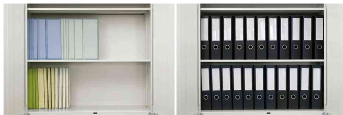
spart im Vergleich zu herkömmlichen Ablageordnern enorm viel Platz