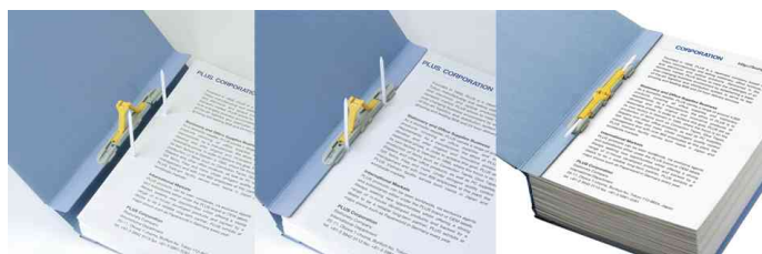
Archivierungsordner ZEROMAX, One-Touch-Mechanik