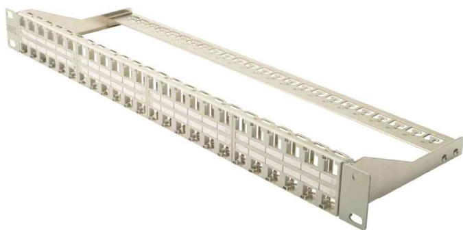
19" Modular Patch Panel Kat. 6A, lichtgrau

• 1HE • geschirmt • Patch Panel für Keystone Module, passend für DN-93604, DN-93615 & DN-93616 • Werkstoff Gehäuse: SPCC, 1,0mm kaltgewalzter C-Stahl gem. JIS G3141-1996 • transparente Logofelder • geeignet für 483mm (19") Schrank Montage