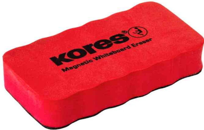
Tafellöcher / Whiteboard-Schwamm, magnethaftend

- zur einfachen Trockenreinigung von Weißwandtafeln