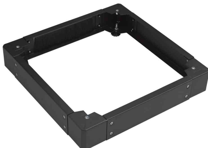
Sockel für 19" Serverschränke, schwarz