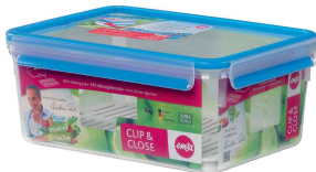
Frischhaltedose CLIP & CLOSE, mit Abtropfgitter N:\VivalP\Koepe\42264\344621.jpg

- mehr Frische für: Gemüse, Wurst, Käse, Obst und flüssige Lebensmittel