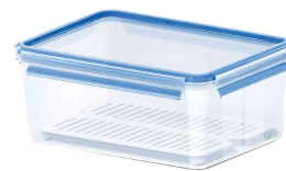
Frischhaltedose CLIP & CLOSE, mit Abtropfgitter N:\VivalP\Koepe\42264\344621_01_scha.jpg