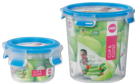
Frischhaltedose CLIP & CLOSE