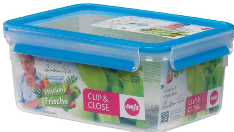
Frischhaltedose CLIP &amp; CLOSE