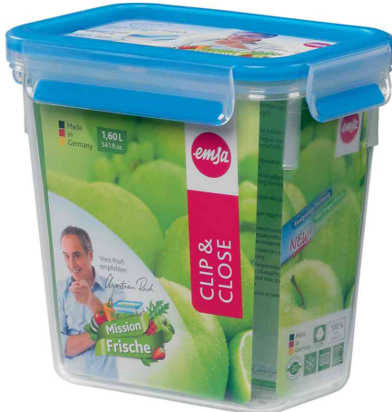
Frischhaltedose CLIP & CLOSE