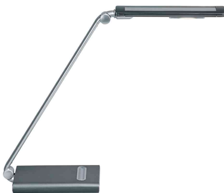
LED-Tischleuchte MAULpure, dimmbar, mit Standfuß