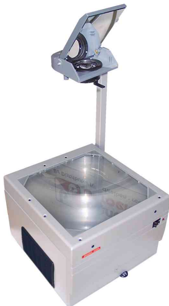
Overhead-Projektor EcoLux 455