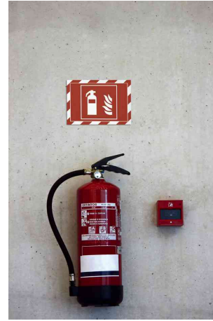
Farbe: rot/weiß - Anwendungsbeispiel