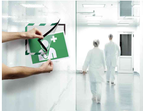
Farbe: grün/weiß - Anwendungsbeispiel