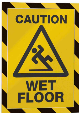
Farbe: gelb/schwarz - Anwendungsbeispiel