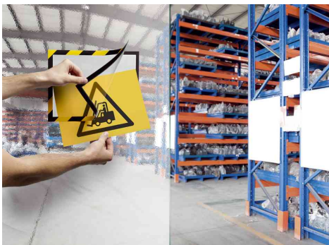
Farbe: gelb/schwarz - Anwendungsbeispiel