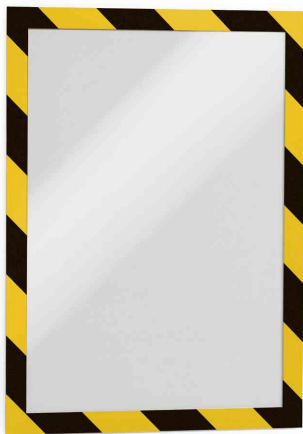
Magnetrahmen DURAFRAME SECURITY, gelb/schwarz