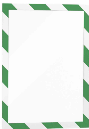
Magnetrahmen DURAFRAME SECURITY, grün/weiß