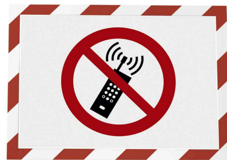
Farbe: rot/weiß - Anwendungsbeispiel