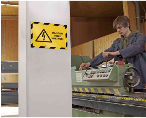
Farbe: gelb/schwarz - Anwendungsbeispiel