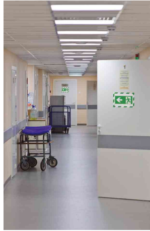
Farbe: grün/weiß - Anwendungsbeispiel