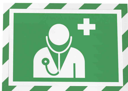
Farbe: grün/weiß - Anwendungsbeispiel