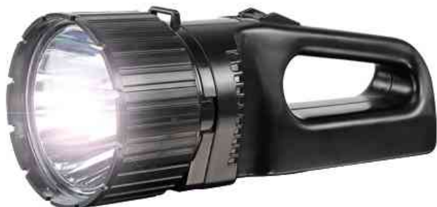
LED-Handscheinwerfer "Future HS100FR"