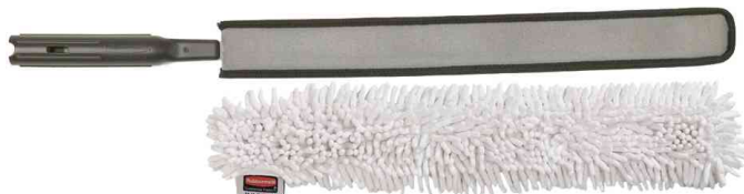
Kit de dépeussierage flexible hautes performances HYGEN, séparément