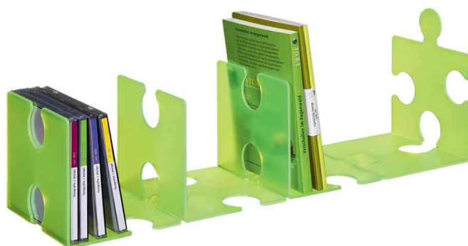
Buchstütze PUZZLE, Anwendung