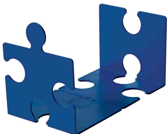
Buchstütze PUZZLE, blau

• aus hochwertigem Kunststoff • verkettbar und dadurch extrem standfest • unbegrenzt ausbaufähig • VE = 2 Stück, Abgabe nur in ganzen VE's