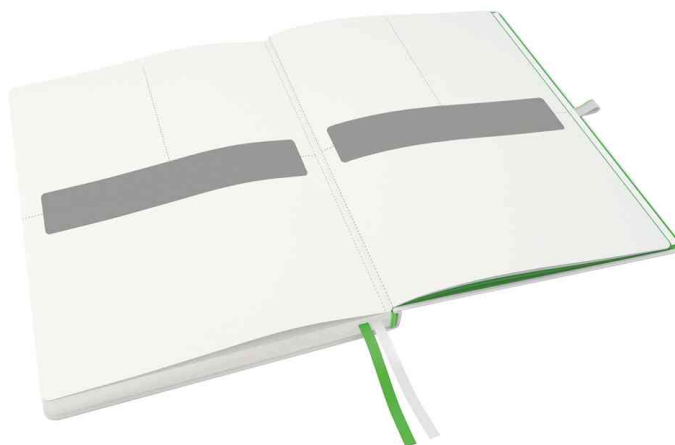
perforierte Blätter für Notizen