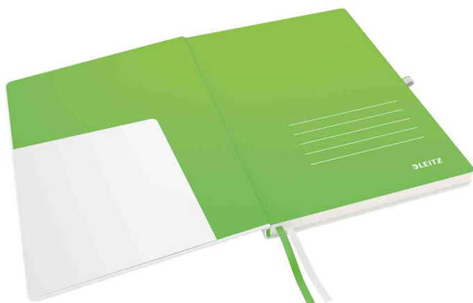
Innentasche im Vorderdeckel