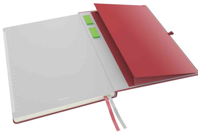
große dehnbare Innentasche im Rückdeckel + Haftnotizen