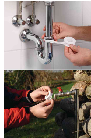
Zum Abdichten von Schraubgewinden, Ventilen etc.