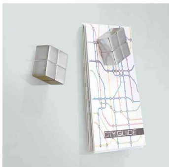
Beschriftbar und magnetisch