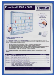
Magnet-Tasche FRAME IT X-tra!Line, blau