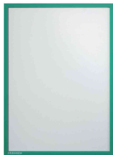
Magnet-Tasche FRAME IT X-tra!Line, grün