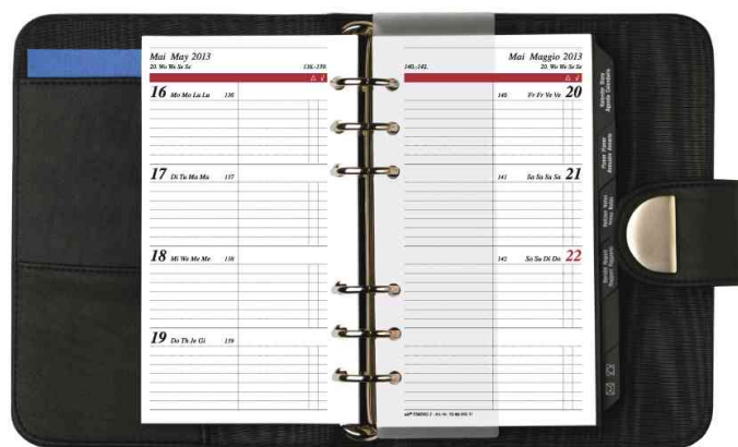
Calendrier "Timing 2", intérieur