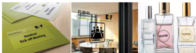
Folien-Etiketten SPECIAL, Anwendung