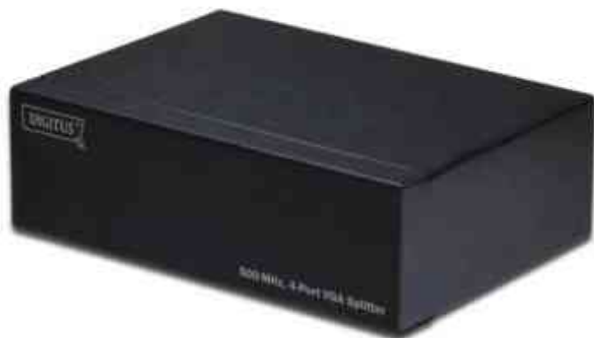
Répartiteur VGA 500 MHz, 4 ports