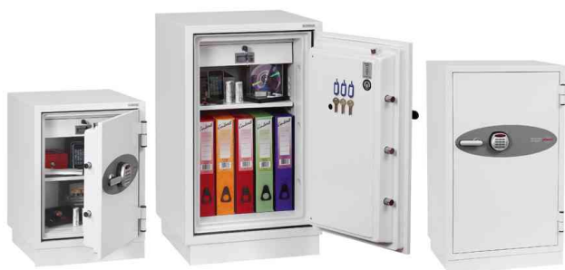
Feuerschutz-Tresor FIRE FIGHTER II