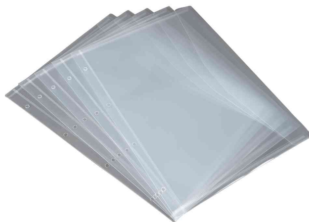
Accessoires: pochettes de rechange