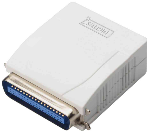
Fast Ethernet Printserver