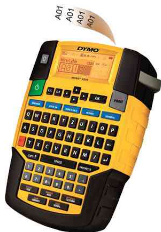
Industrie-Beschriftungsgerät "RHINO 4200"